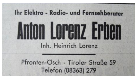
Reklame 1975 - Tiroler Str. 59

1977 Übernahme des Geschäftes durch das E-Werk Reutte.