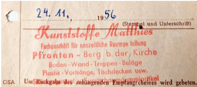
Text und Fotos: Sieglinde Birk, geb. Schneider, Privat, Allgäuer Zeitung