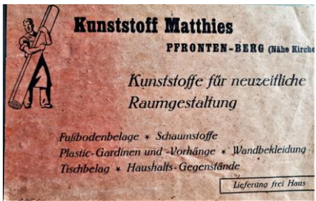
Reklame ca. 1956