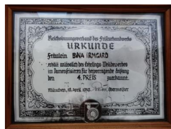
1939 Urkunde - Irmgard Bina