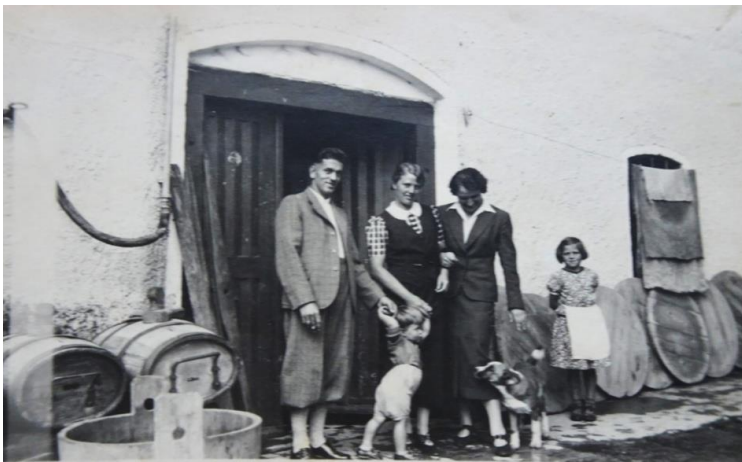
Fam. Sontheim vor der Käserei in Josereute