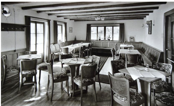
Ende vom Café ca. 1969