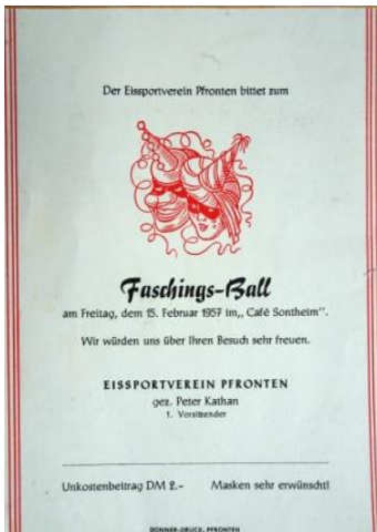
z.B. EVP Ball 1957

Im Café Sontheim fanden auch Faschingsbälle statt.