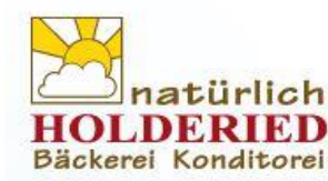
Reklame der Bäckerei in Lindenberg