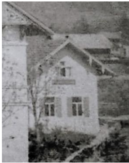
ehem. Wohnhaus vor 1895

Produkte: Schuhhandlung mit Reparaturwerkstatt seit 1895