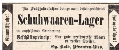
1899 - Inserat Kaufhaus Kolb

Schon 3 Jahre später, 1895, wurde das Unternehmen im eigenen Haus zu einer Schuh- und Gemischtwarenhandlung mit 50qm Verkaufsfläche umgestaltet.