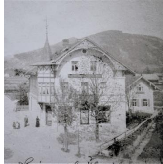
Wohnhaus re. 1895 Gründung vom Kaufhaus im Neubau