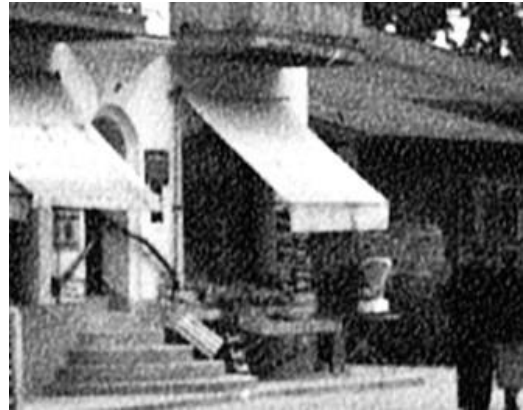
re. Seite - bis ca. 1961 war hier das Lebensmittelgeschäft „Bernhart“