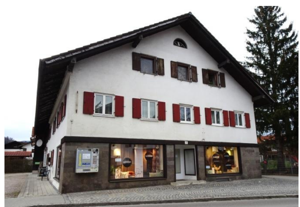
Ried, Allgauer Str. 1