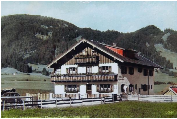
1961 – Gasthaus