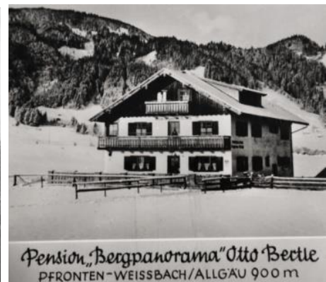
1948 - Pension