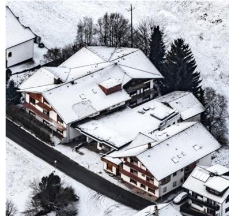
1972/73 wurde das Gasthaus zum Hotel erweitert.