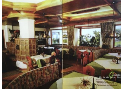
1963 wurde der Speisesaal angebaut