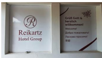
Reikartz Hotel Group

Inhaber: 2015 wurde das Hotel an eine ausländische Investoren-Gruppe verkauft und ab dem Corona-Lockdown im März 2020 ganz geschlossen.