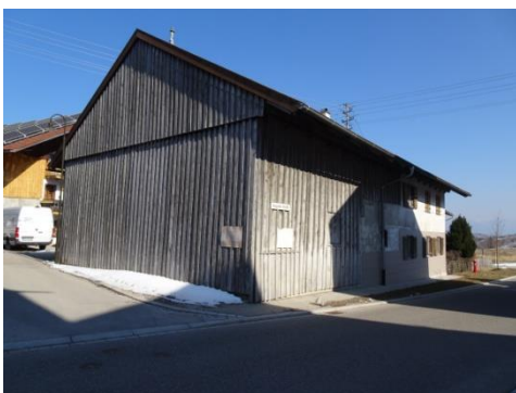
Kappel 45, Kappeler Str. 4